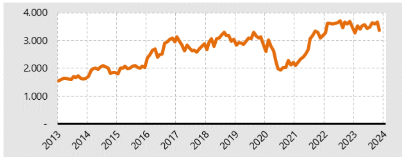
Grafik 3. Die Entwicklung der Arbeitslosen- quote in den Kreisfreien Städten Schleswig-Holsteins seit 2013