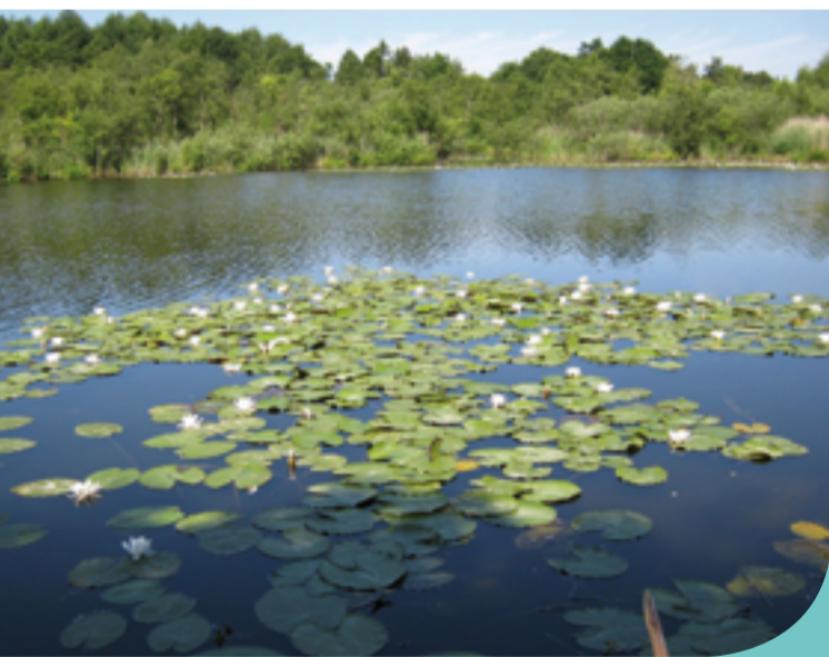
Seerosen auf dem Langsee

In den windgeschützten Seebuchten verlanden große Flächen: Sie wachsen mit Seggen zu, so dass sich die Wasserfläche verkleinert. Die Verlandung zählt zu den natürlichen Prozessen in einem See. Diese Bereiche bieten zahlreichen Vogelarten einen vielfältigen, störungsfreien Lebensraum. Neben den bekannten Wasservögeln wie Höckerschwan, Stockente und Blässhuhn leben hier auch bei uns selten gewordene Arten wie Haubentaucher, Rohrammer, Sumpf- und Teichrohrsänger.