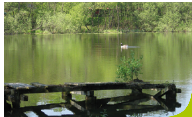
Blick auf den Langsee

Vor allem an den südlichen und südwestlichen Rändern des Langsees befinden sich ausgedehnte, von Störungen unbeeinträchtigte Zonen mit Schilfröhrichten sowie Erlen- und Weidenbruchwäldern.