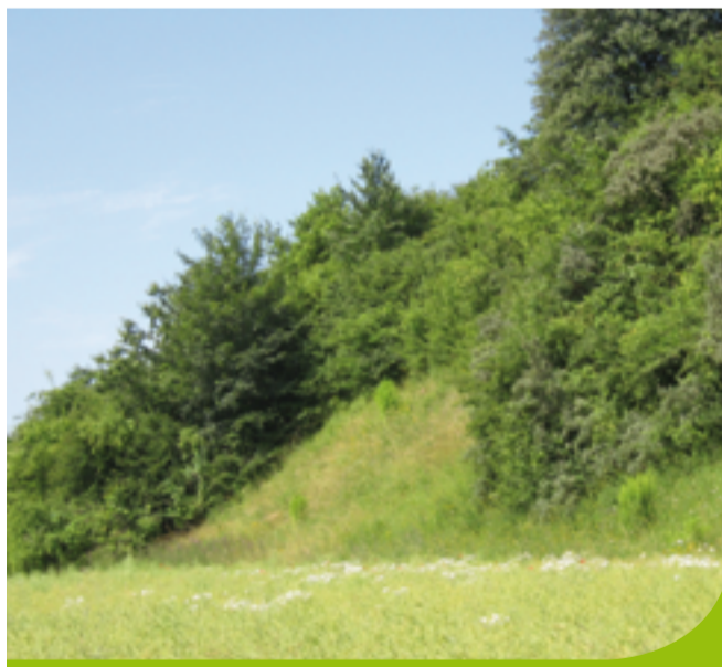
Blick über den Trockenhang

Bis etwa 1970 wurden diese Flächen als Wiese genutzt. Auf feuchten Flächen, die längerfristig vom Menschen ungenutzt bleiben, können sich allmählich Erlen und Weiden entwickeln. Vereinzelt wachsen hier Holunderbüsche.