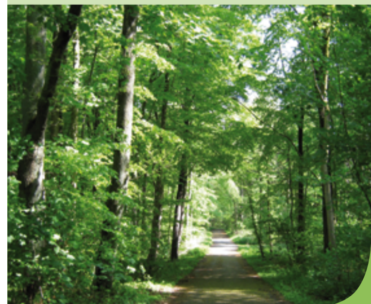
Rundweg am Kuckucksberg

Für weitere Informationen können Sie sich an das Umweltschutzamt der Landeshauptstadt Kiel, Holstenstraße 106-108, Telefon 0431/901-3782, wenden.