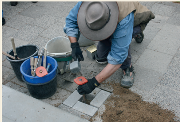
Der Kölner Künstler Gunter Demnig hat bereits mehr als 72.000 Stolpersteine für Opfer des Nazi-Regimes verlegt.

Auf den etwa 10 x 10 Zentimeter großen Stolpersteinen sind kleine Messingplatten mit den Namen und Lebensdaten der Opfer angebracht. Sie werden vor dem letzten frei gewählten Wohnort in das Pflaster des Gehweges eingelassen. Inzwischen liegen in mehr als 1.330 Städten in Deutschland und 23 weiteren Ländern Europas mehr als 72.000 Steine. Auch in Kiel werden seit 2006 jährlich neue Stolpersteine verlegt.