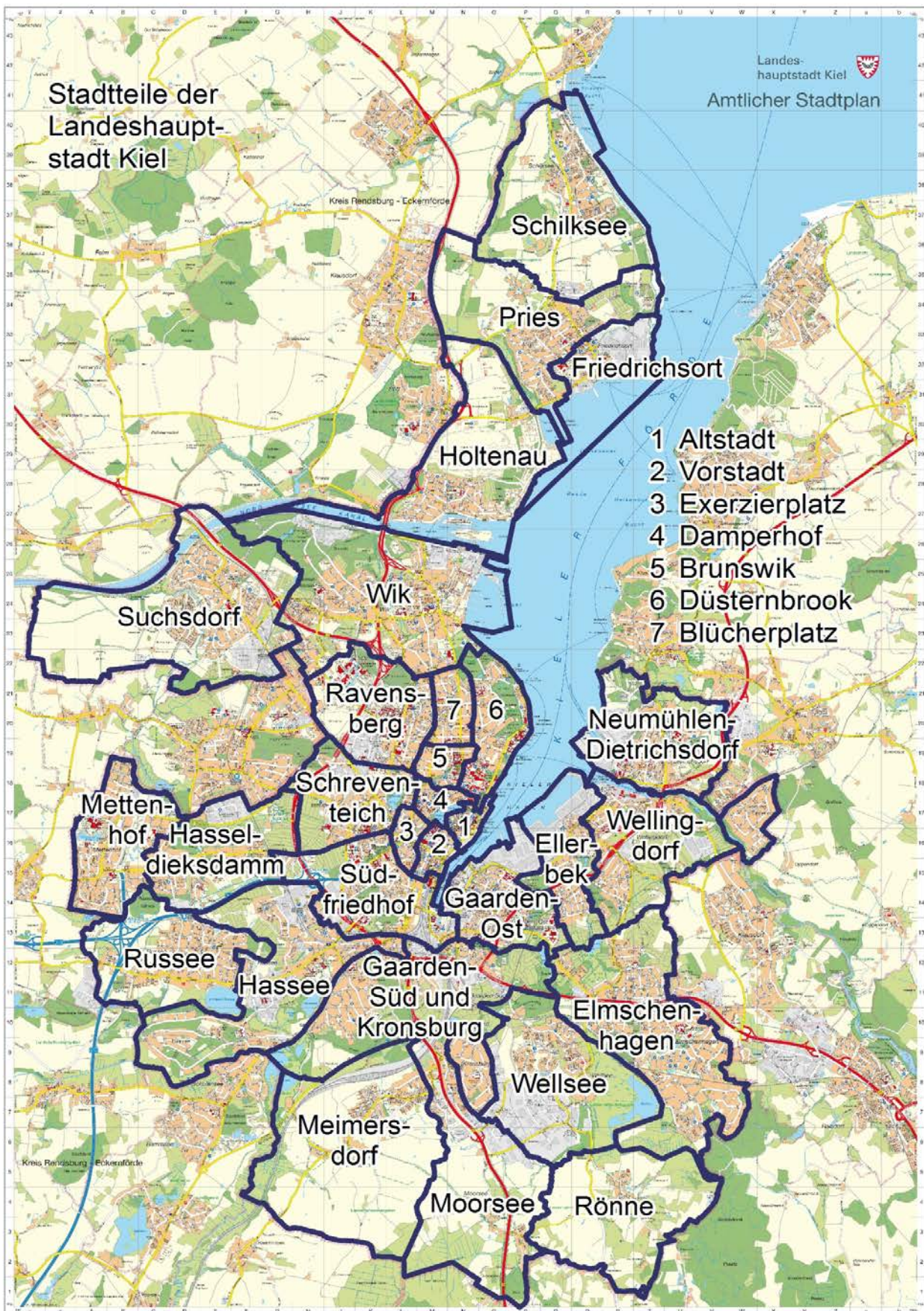
Grafik 102. Die Kieler Stadtteile