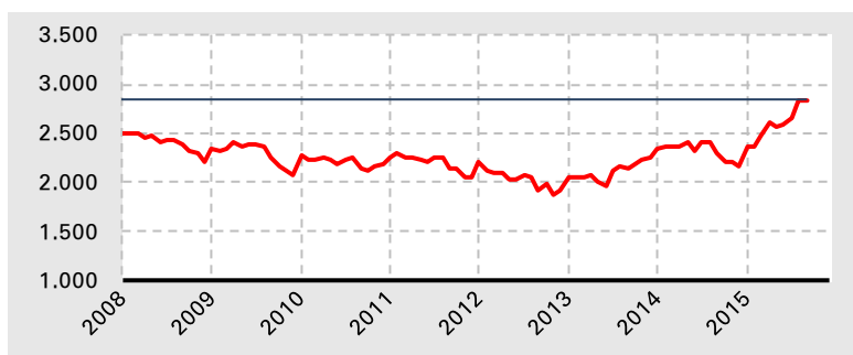
Grafik 3. Die Entwicklung der Arbeitslosigkeit in den kreisfreien Städten Schleswig- Holsteins