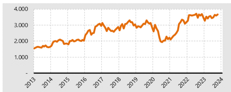
Grafik 3. Die Entwicklung der Arbeitslosen- quote in den Kreisfreien Städten Schleswig-Holsteins seit 2013