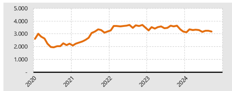
Grafik 3. Die Entwicklung der Arbeitslosen- quoten in den Kreisfreien Städten Schleswig-Holsteins seit 2020