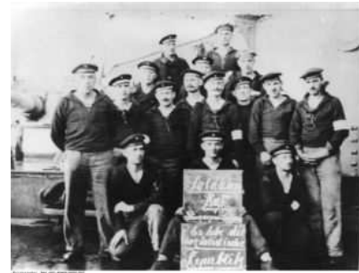
Soldatenrat des Linienschiffs Prinzregent Luitpold

Ein großer Teil der Marinegebäude ist auch heute noch nahezu unverändert vorhanden. Besonders fällt die Petruskirche, die ehemalige Garnisonskirche, ins Auge.