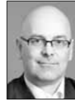
Oberbürgermeister Torsten Albig SPD