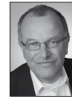
Stadtrat Wolfgang Röttgers SPD