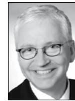
Bürgermeister Peter Todeskino GRÜNE